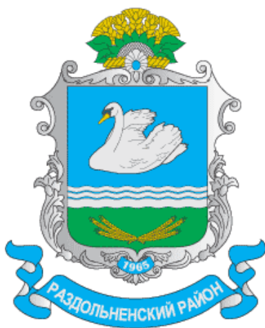
Схема теплоснабжения муниципального образования Раздольненский район Республики Крым на период 2016-2031 гг.